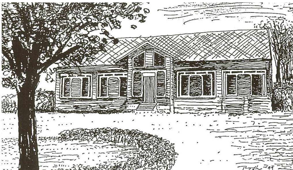
Obr. 1 Pohľad na objekt penziónu

Z poľnohospodárskeho hľadiska ide o intenzívne využívané polia s kvalitnou pôdou černoziem. V zmysle rajonizácie poľnohospodárskych výrobných typov je to oblasť kukuričného výrobného typu. Predmetné územie je dlhodobou intenzívne produkčne využívané, čoho následkom sú len pozostatky pôvodných lesných plôch a remízok zmiešaných dúbav. Dnes nahradené prevládajúcimi porastmi agátu.