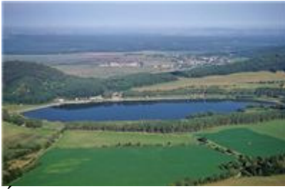
Údolná priehrada Buková

Poloha: Malé Karpaty Región: Dolné Považie